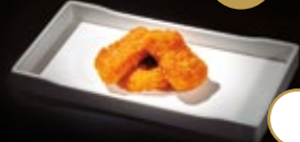
262 / NUGGETS DE POLLO Alérgenos: 1