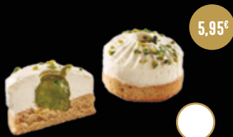
401 / DULZURA ORIENTAL