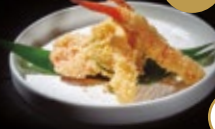
271 / TEMPURA MORIAWASE