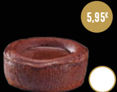
408 / COULANT DE CHOCOLATE