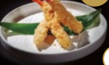
270 / EBI TEMPURA