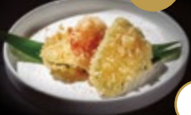
272 / YASAI TEMPURA