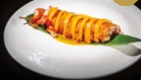
275 / PATO A LA NARANJA Alérgenos: 1