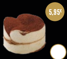
405 / TIRAMISÚ