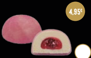
416 / MOCHI DE CHEESECAKE