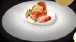
85 / TARTAR SHIRO SHAKE Alérgenos: 1,4,6,11