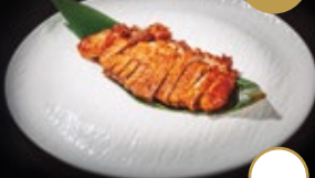
274 / PATO Alérgenos: 1