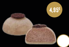
415 / MOCHI DE OREO