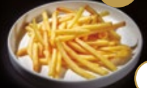
269 / PATATAS FRITAS Alérgenos: 1