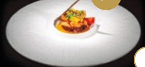
87 / TARTAR KURO SHAKE Alérgenos: 1,4,6,11,15