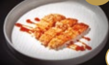
268 / SHAKE FURAI Alérgenos: 1,4,6