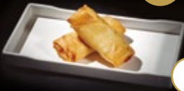
260 / HARUMAKI POLLO Alérgenos: 1,6,11