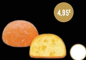
414 / MOCHI DE MANGO