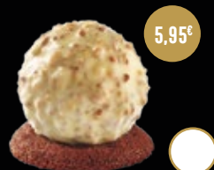
403 / ROCHER CHOCOLATE BLANCO