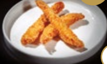
267 / TORI FURAI Alérgenos: 1,6