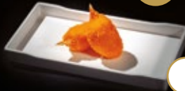
261 / PINZAS DE CANGREJO Alérgenos: 1,2,3,4,6