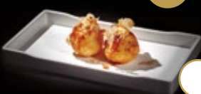
263 / TAKOYAKI Alérgenos: 1,3,4,6,14