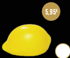
404 / LIMÓN