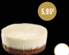
410 / CHEESECAKE SPÉCULOOS