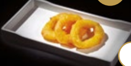
265 / ANILLAS DE CALAMAR Alérgenos: 1,3,14