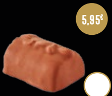
402 / LINGOTE CACAHUETE CARAMELO