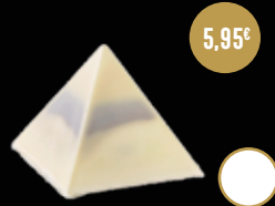
409 / PIRÁMIDE CHOCOLATE BLANCO