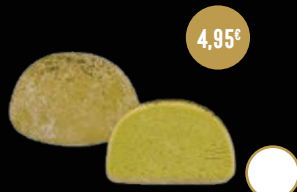
418 / MOCHI DE TÉ MATCHA