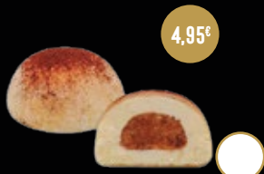
417 / MOCHI DE TIRAMISÚ