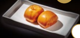
266 / PAN FRITO Alérgenos: 1,7