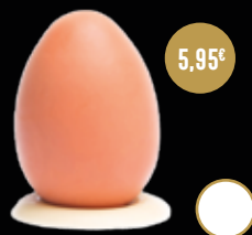
406 / HUEVO DE CHOCOLATE BLANCO Y MANGO