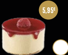
407 / SOUFFLÉ DE VAINILLA FRAMBUESA